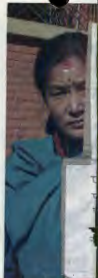
बेपत्ता नागरिकका आफन्तहरू संयुक्त