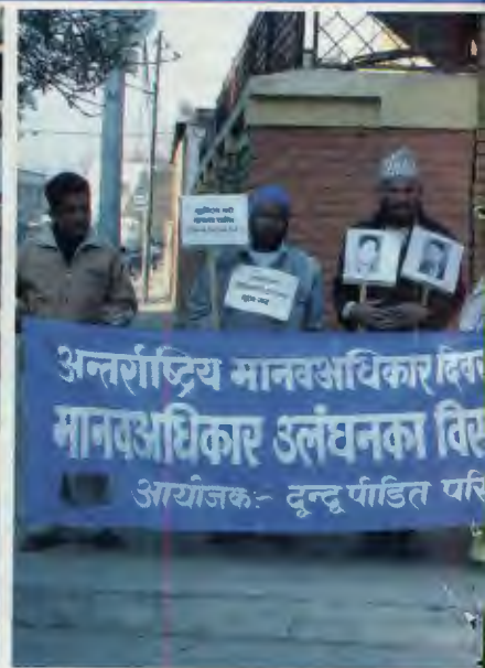
संयुक्त राष्ट्र संघ