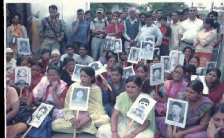
प्रधानमन्त्री निवास बालुवाटारमा धर्ना दिदै ।