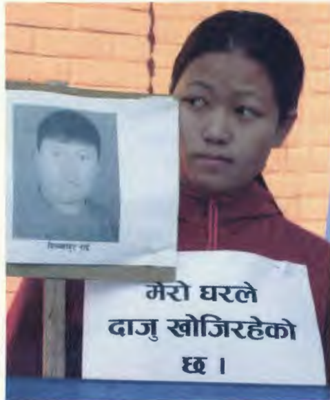
संयुक्त राष्ट्र संघको नेपालस्थित कार्यालयमा धर्ना दिदै