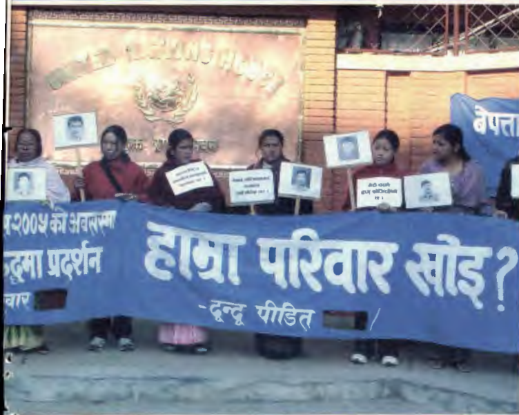
बेपत्ता नागरिकको स्थिति कार्यालयमा धर्ना दिदै

सशस्त्र द्वन्द्वका क्रममा १३ हजार ३ सय ४७ जना मारिएका छन् भने ८ सय २८ जनालाई राज्य पक्षबाट बेपत्ता पारिएको तथ्यांक इन्सेकको छ। राज्यद्वारा बेपत्ता पारिएका नागरिकका परिवारले आफ्ना प्रियजनको स्थिति थाहा पाउन विभिन्न समयमा प्रधानमन्त्री निवास, भद्रकाली स्थित सैनिक मुख्यालय, संयुक्त राष्ट्र संघको नेपाल स्थित कार्यालय तथा राष्ट्र संघीय मानवअधिकार उच्चायुक्तको कार्यालयमा धर्ना दिनुको साथै राष्ट्रिय मानवअधिकार आयोगमा तालाबन्दी समेत गरेका थिए। आफ्ना स्वजनहरूको स्थिति सार्वजनिक गर्न सरकारलाई दबाव दिन हस्ताक्षर संकलन गरी संयुक्त राष्ट्र संघीय मानवअधिकार उच्च आयोगको सन् २००६ मा जेनेभामा आयोजित बैठकमा नेपालस्थित उच्च आयोगको कार्यालय मार्फत पठाएका थिए। बेपत्ता पारिएका व्यक्तिहरूका बारेमा चासो व्यक्त गर्दै आवाज उठाउँदै आएका राष्ट्रिय तथा अन्तर्राष्ट्रिय मानवअधिकारवादी संघ संस्थाहरूले अब सर्वोच्च अदालतको आदेशलाई कार्यान्वयन गराउन सरकारलाई दबाव दिनु पर्ने देखिन्छ।