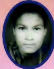
सेतु विक ०६३ वैशाख ५ गते