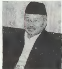
सुवास नेम्वाङ, सभामुख, अन्तरिम व्यवस्थापिका

जनआन्दोलनका दोषीमाथिको कारबाही सिङ्गो राष्ट्रको माग हो। लोकतन्त्रमा दण्डहीनता स्वीकार्य हुँदैन। रायमाभी आयोगको प्रतिवेदन तुरून्त सार्वजनिक गरी दोषीमाथि कारबाही हुनपर्दछ।