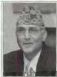
केपी शर्मा ओली

रायमाभी आयोगले राजालाई कारबाही गर्न सिफारिस नगरेकाले प्रतिवेदन कार्यान्वयन गर्नु उचित ठानिएन। कार्यदल अनुसन्धान गर्ने निकाय नभएकाले आयोगको सिफारिसभन्दा बढी कारबाही गर भन्न नसकिएको हो।