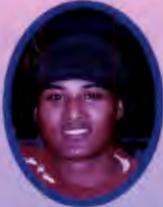
सगुन ताम्राकार ०६३ वैशाख ७ गते