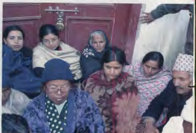
राष्ट्रिय मानवअधिकार आयोगमा तालाबन्दी गर्दै ।