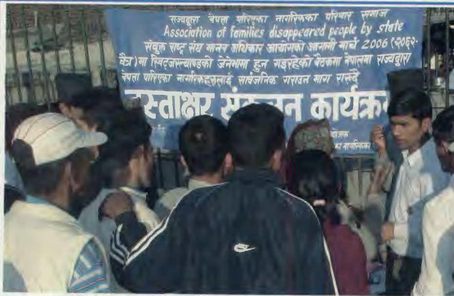
हस्ताक्षर संकलन गर्दै ।