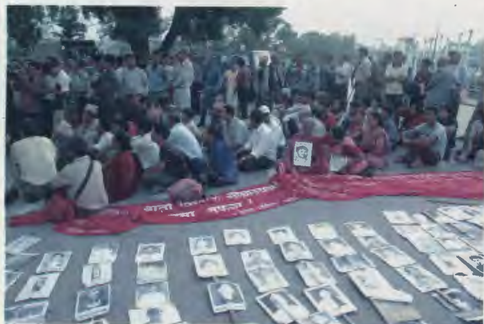
भद्रकालीस्थित सैनिक मुख्यालय अगाडी धर्ना दिँदै ।