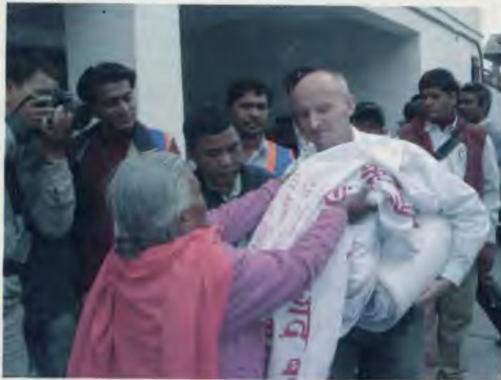
राष्ट्र संघीय मानवअधिकार उच्चयोगका नेपाल स्थित कार्यालयका प्रतिनिधिलाई संकलित हस्ताक्षर बुझाउँन जाँदै ।