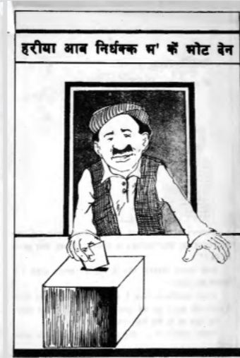
संसदीय निर्वाचन २०४८ मा मतदाता शिक्षाका लागि इन्सेकद्वारा प्रकाशित मैथली भाषाको सूचना र पुस्तिका