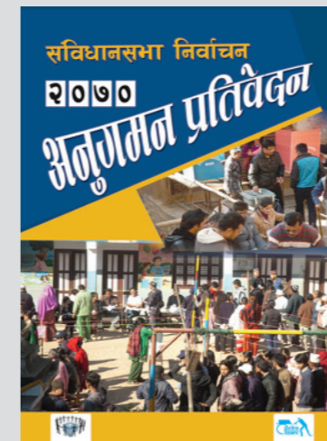
इन्सेकद्वारा प्रकाशित संविधानसभा निर्वाचन २०७० को प्रतिवेदन