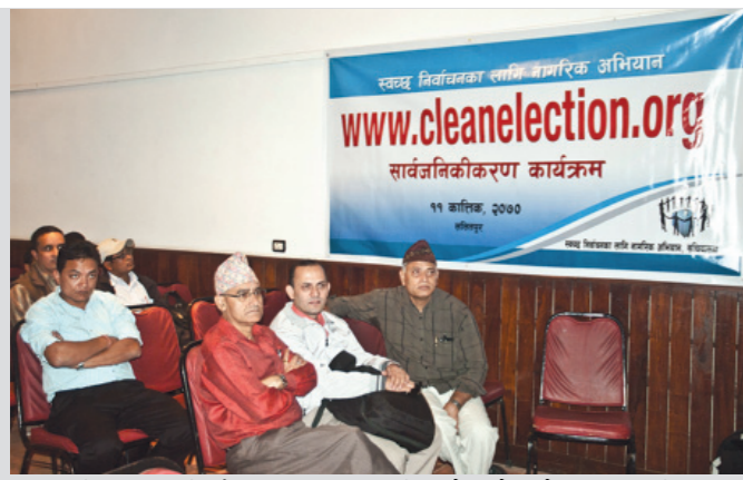
संविधानसभा निर्वाचन अनुगमनका लागि इन्सेकको संयोजकत्व स्थापित www.cleanelection.org को सार्वजनिकीकरणको कार्यक्रम