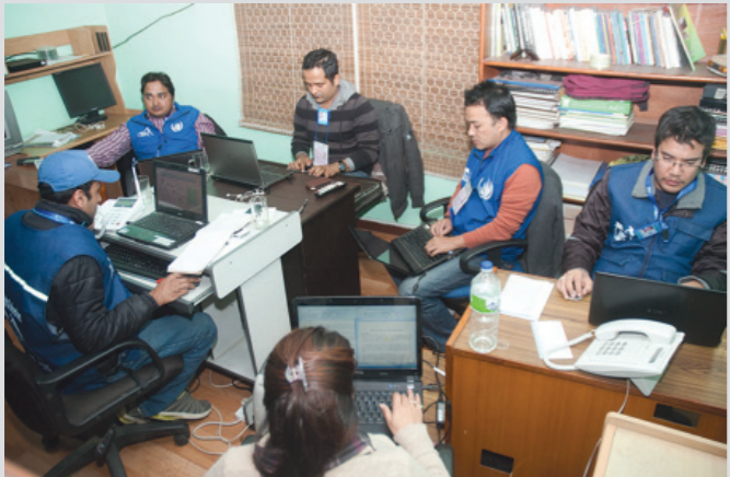
संविधानसभा निर्वाचनको अभिलेखीकरणमा इन्सेकका कर्मचारीहरू