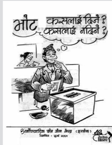
आम निर्वाचन २०५६ मा मतदाता शिक्षाका लागि इन्सेकद्वारा प्रकाशित पुस्तिका