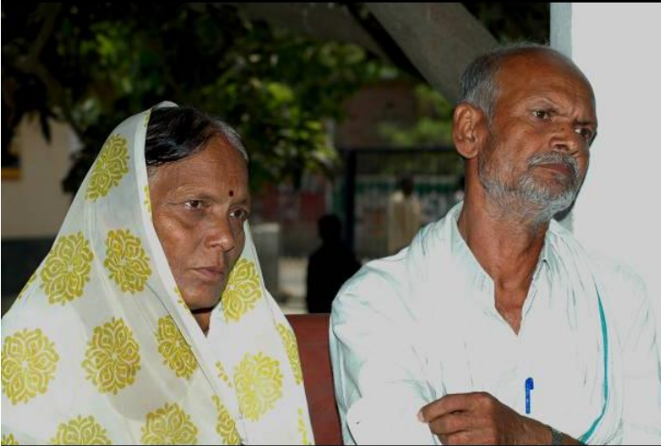
विष्फोटनमा मृत्यु भएका पिन्टुका बुवा र आमा