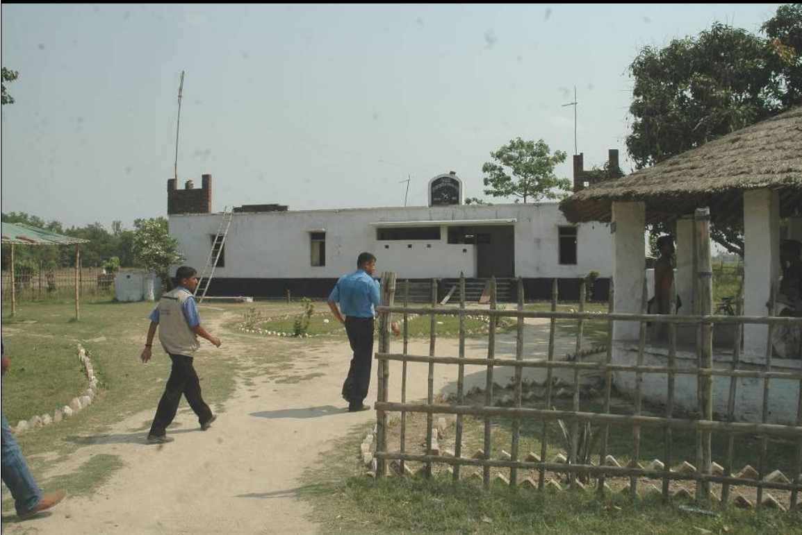
घटनास्थलबाट करिब डेढ किलोमीटरको दूरीमा रहेको इलाका प्रहरी कार्यालय