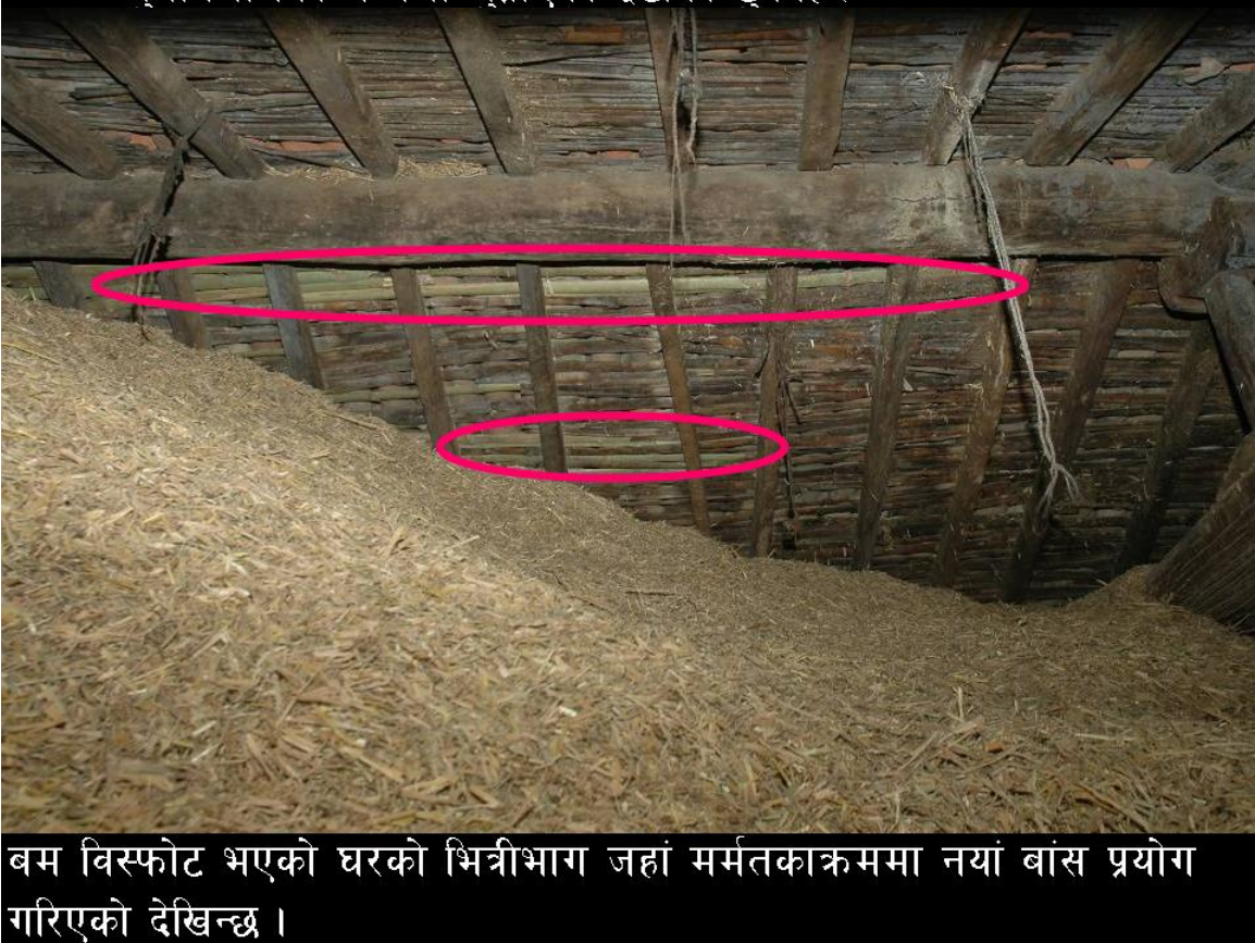
बम विस्फोट भएको घरको भित्रीभाग जहां मर्मतकाक्रममा नयां बांस प्रयोग गरिएको देखिन्छ ।