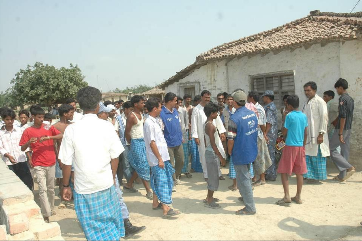
घटनास्थलमा पुगेका मानवअधिकारकर्मीसंग स्थानिय बासिन्दाहरु