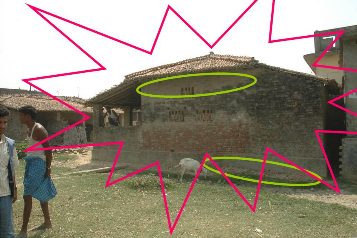
बम विस्फोट भएको घर : घेरामा नया भित्ता र तल तिर पुननिर्माणका क्रममा थप्रीएका ईटाका टुक्राहरु